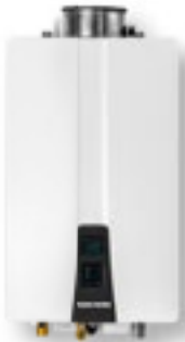
NPN-Universal configurado para interiores

Tome la decisión inteligente y disfrute sumergirse en agua caliente continua con Navien