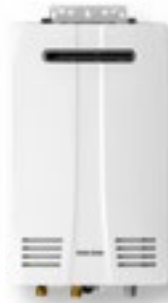
NPN-Exterior solo para uso en exteriores