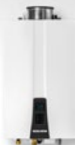
NPN-Universal para interiores y exteriores