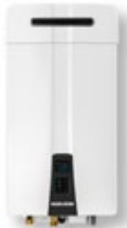
NPN-Universal con tapa de ventilación para uso en exteriores