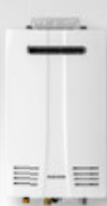
NPN-Exterior sólo para exteriores

Calentadores de agua sin tanque Navien Premium No-Condensados